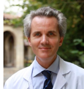
Pr. Raphaël Gaillard

“ La schizophrénie touche en France 600 000 personnes auxquelles il faut ajouter les proches et les familles. Ce sont plus de 1,5 million de personnes qui doivent faire face à la maladie mais aussi au regard méfiant, négatif de la société qui véhicule une image caricaturale et violente des personnes vivant avec cette pathologie qui pourtant se diagnostique et se soigne. Nous souhaitons aujourd’hui lancer un challenge d’envergure : changer ce regard pour déstigmatiser la maladie et pour mieux inclure celles et ceux qui sont concernés. ■